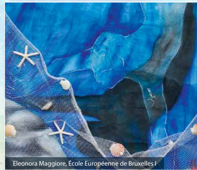
Eleonora Maggiore, École Européenne de Bruxelles I

Encourager et promouvoir la valorisation du capital social et de l'héritage culturel des communautés de pêcheurs, afin de poursuivre et d'entretenir des relations durables avec la mer et les zones côtières, y compris à travers des expositions et diverses formes de communication.