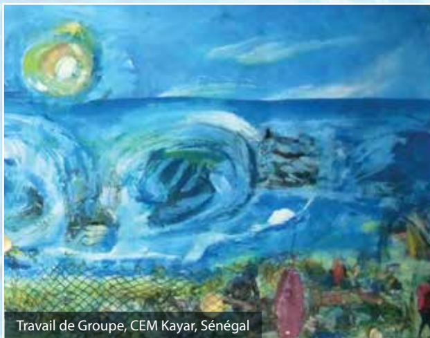
Travail de Groupe, CEM Kayar, Sénégal

Des scientifiques, artistes, enseignants, parents originaires de différentes régions du monde et réunis pour promouvoir la transition vers des valeurs et des pratiques durables ainsi que des vies plus dignes et plus humaines.