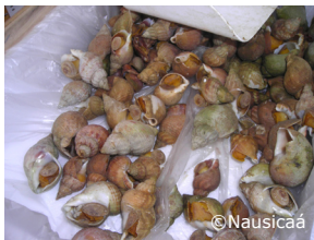
Bulots sur les étals des poissonniers.