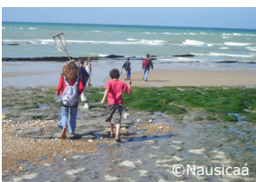
Sortie découverte du littoral.